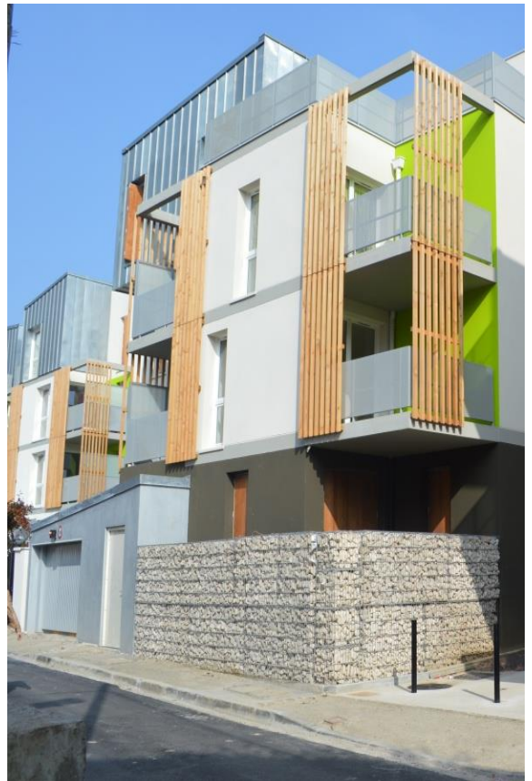
Logements « Opus Verde »