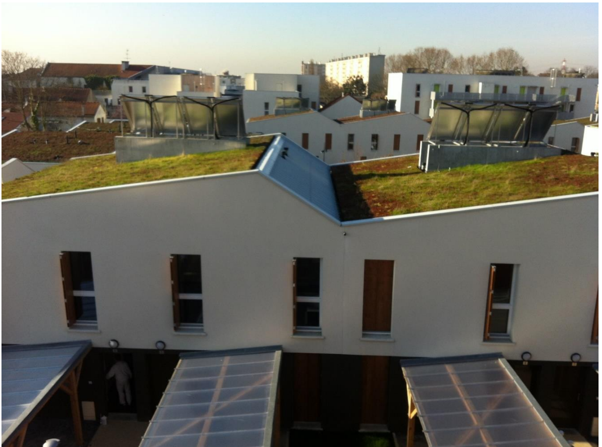
Logements « Opus Verde »